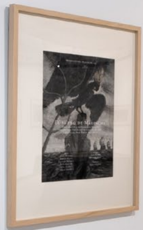
EL SUEÑO DE MALINCHE

El sueño de Malinche se estrenó el 25 de febrero de 2019 en el Museo del Prado.